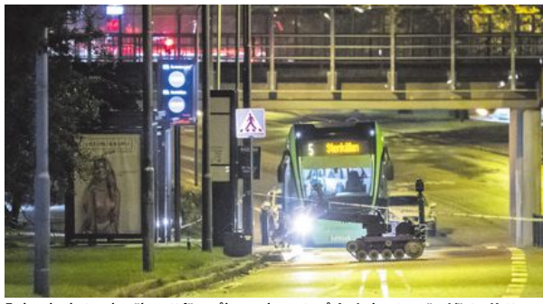
En bombrobot undersöker ett föremål som placerats på Amiralsgatan nära Västra Kattarpsvägen. Föremålet visade sig vara ofarligt och tros vara ett av de flera hundra sabotage mot blåljusverksamhet som drabbat Malmö den senaste månaden.

Sedan början av oktober har polisen och räddningstjänsten i Malmö plågats av ett stort antal falsklarm. Inringaren har påstått att allvarliga brott har begåtts, vilket lett till stora pådrag från polis och brandkår. Snart slog polisen fast att det rörde sig om en eller flera personer