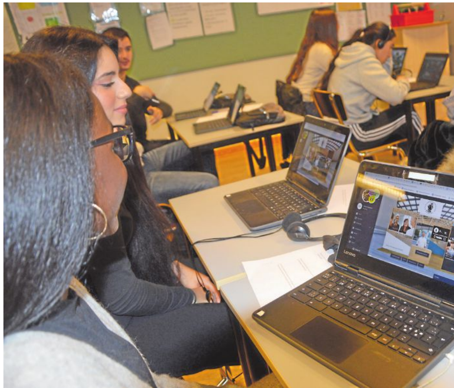
Niorna fick ingen mingelmässa för att förbereda gymnasievalet i år på grund av coronan. I stället får de besöka de olika gymnasieskolorna virtuell.