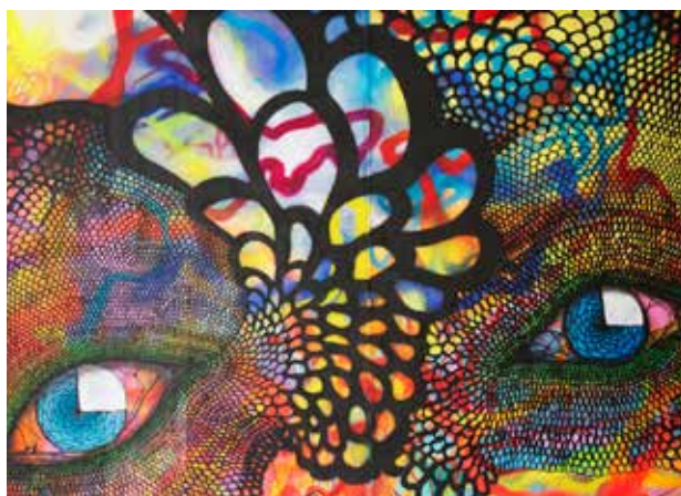
Spana in vår snygga väggmålning av Carolina Falkholt i Kølsvinet!

Kølsvinet är Kårens lokal på Kårhuset. Här kan du som är medlem ta en kopp kaffe, hänga med vänner och plugga. Det är även här de flesta av Kårens aktiviteter anordnas, och varje onsdag kan du som är medlem köpa sopplunch för ynka 15 kr. Du som är medlem har även möjlighet att hyra Kølsvinet om du till exempel vill ha fest med dina kursare, mer info på malmostudenter.se .